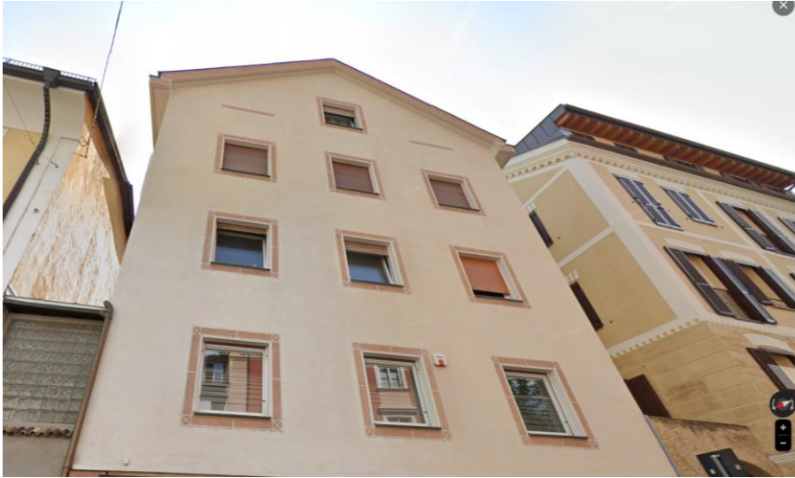
Aufnahme vom Mai 2022.