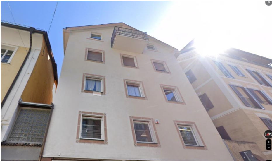
Aufnahme vom September 2023 (Google Maps).