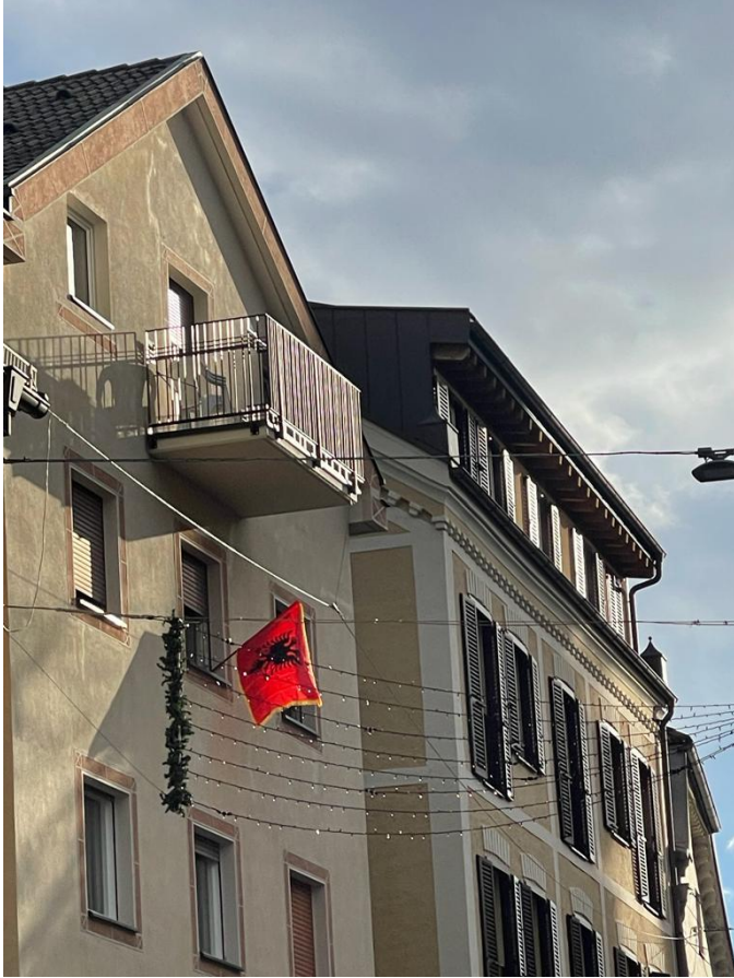
Aufnahme vom November 2023.